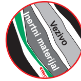
Vreća s dva odjeljka