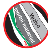
Vreća s dva odjeljka