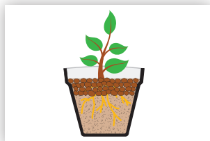
Ukrašavanje i malčiranje.