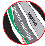
Vreća s dva odjeljka